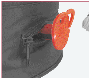
Reissverschluss für integriertes Ventil

0,5 l, geeicht. Aus Steinzeug. Rundum- und mehrfarbiger Druck auf Anfrage. -,45 TD ab 72 Stck. 60 x 60 mm links, rechts oder gegenüber vom Henkel