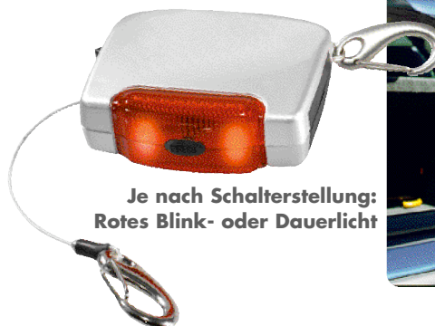
Je nach Schalterstellung: Rotes Blink- oder Dauerlicht

Im Einzelkarton. TD ab 48 Stck. -,30 Ovales Label 50 x 20 mm LG ab 48 Stck. -,85 40 x 20 mm