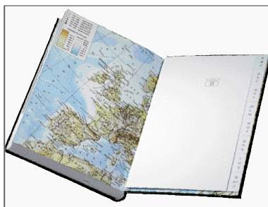
Europakarte und Adressregister