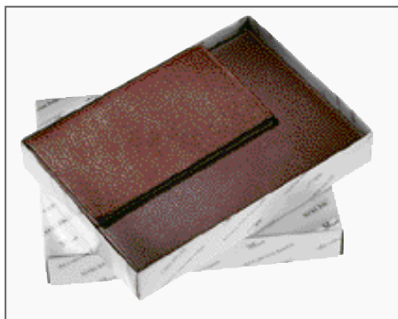
Bildung eigener Geschenksets. Siehe Seite 151