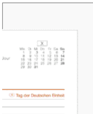
Feiertage in Rot