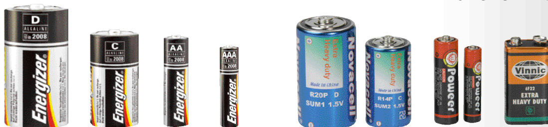
UM1 1,5 V UM2 1,5 V UM3 1,5 V UM4 1,5 V UM1 1,5 V UM2 1,5 V UM3 1,5 V UM4 1,5 V 9 Volt Block